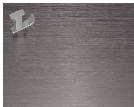
AlumaPlus® Escovado de linha alongada