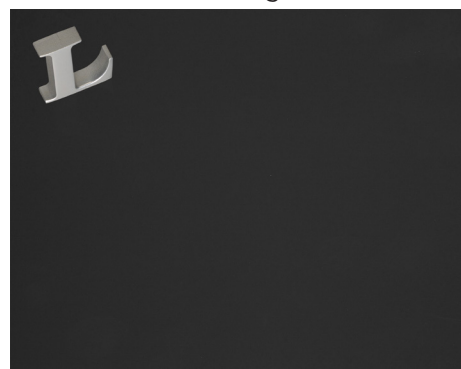
Inoxidável Preto Acabamento de fábrica