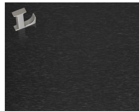
Inoxidável Preto Escovado de linha curta