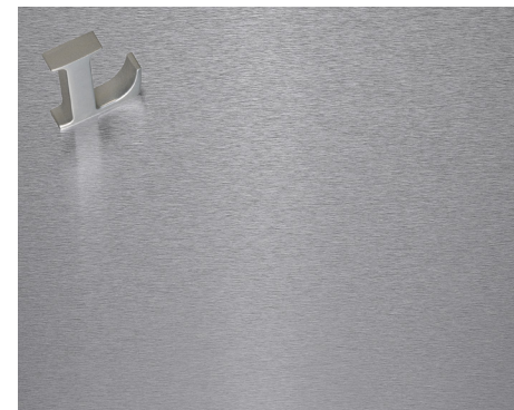
ClearBrite® Escovado de linha curta